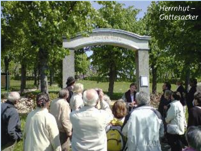
Herrnhut – Gottesacker