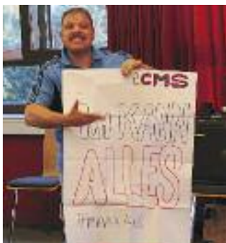
Bericht vom Motivationsseminar