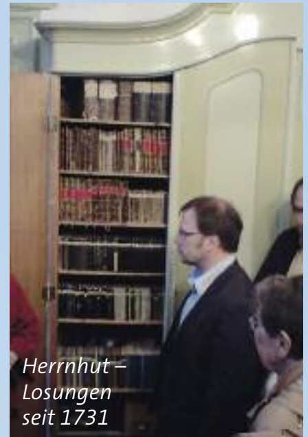
Herrnhut – Losungen seit 1731