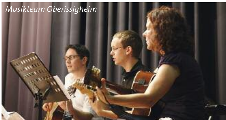
Die „Neuen“ im Verband