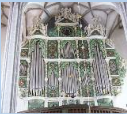
Sonnenorgel Peterskirche Görlitz