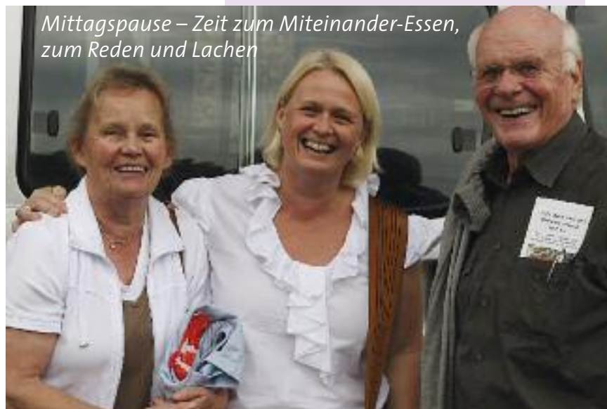
Mittagspause – Zeit zum Miteinander-Essen, zum Reden und Lachen