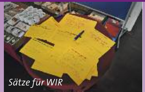
Sätze für WIR