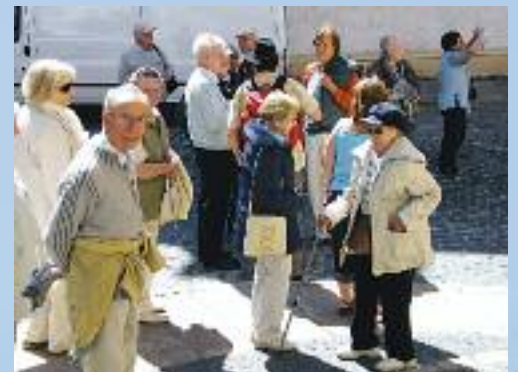
Dom St. Marien – Freiberg

Alles in allem wurden wir reich beschenkt mit vielfältiger Kultur, interessanter Geschichte, wunderbarer Natur, herrlichem Wetter, guter und tragfähiger Gemeinschaft sowie einer gastfreundlichen Unterkunft. Bei allem war die Nähe Gottes spürbar, die auch Ausdruck im gemeinsamen Bibellesen, Beten und Singen finden durfte. Ich möchte meinen Bericht schließen mit einem Lied von Nikolaus Graf von Zinzendorf: „Mein Freund, wie dank ich's deiner Liebe...“. Ja, wir sind Jesus sehr dankbar für eine bewahrte und segensreiche Zeit auf den Spuren Zinzendorfs!