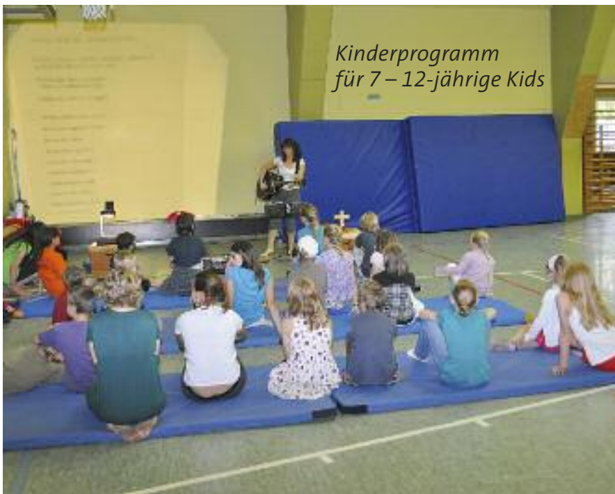
Kinderprogramm für 7 – 12-jährige Kids