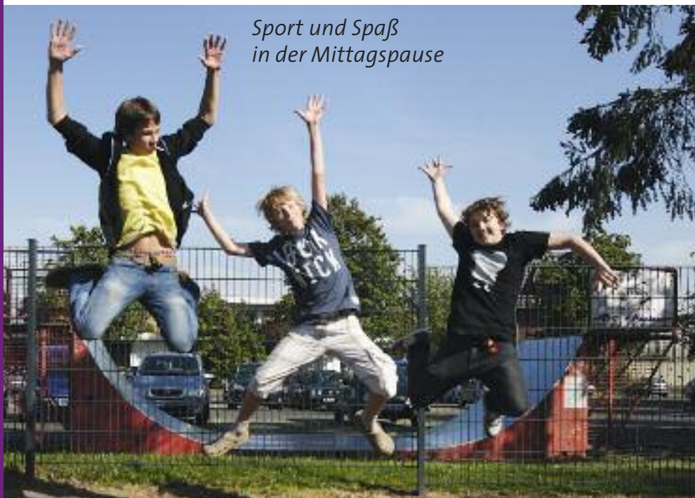
Sport und Spaß in der Mittagspause